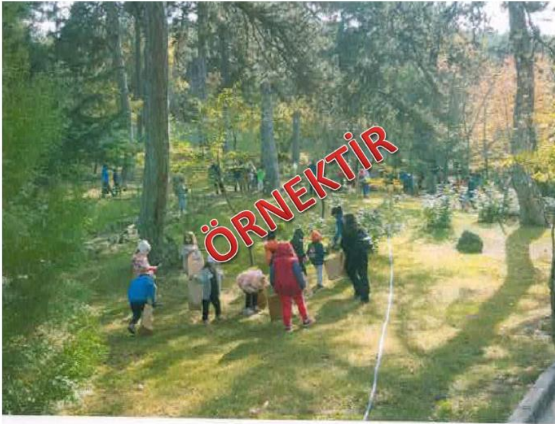
Ormanda Doğa Yürüyüşü